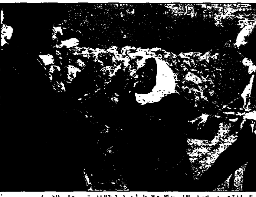
فلسطينية تصرخ بصوت عالٍ بعد الاستيلاء على أرض في قرية الخضر قرب بيت لحم